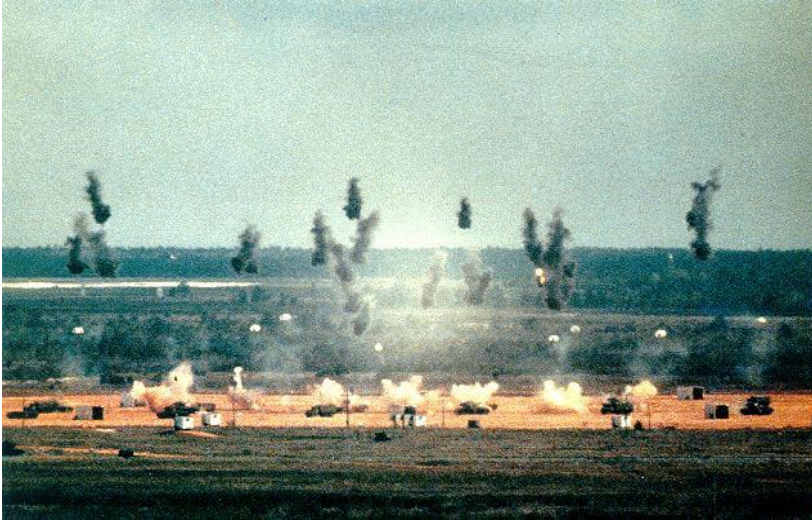
Слика 3. Дејство касетног пројектила

Касетне бомбице које нису одмах при приземљењу експлодирале, веома су опасне јер имају упаљаче који могу да се активирају услед нагле промене осветљаја (сенка пролазника, при њиховом померању или нагазу на њих).