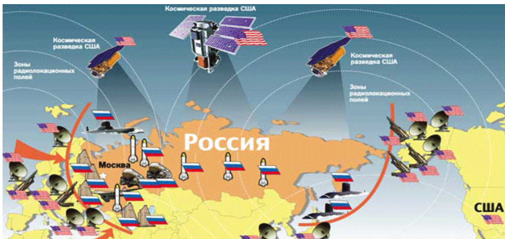
Слика 2. Клешта око Русије