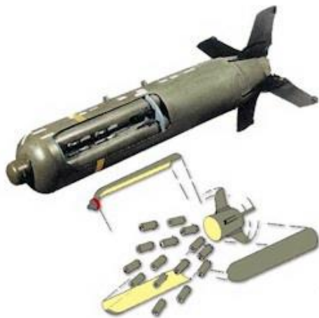
Слика 2. Касетна бомба CBU-89

На СРЈ је бачено више врста касетних бомбица које су намењене убојном дејству по незаштићеној живој сили на отвореном простору. Еклатантан пример кршења Женевске конвенције за заштиту цивила у ратним дејствима је дејствовање касетним бомбама по цивилном становништву у Нишу и Алексинцу, као и по осталим деловима земље насељеним цивилним становништвом. Њиховом употребом се остварује велика површина покривања од (200 - 250) \times (400 - 500) m. Упаљач им је темпирни (5 - 90 s), а боја касетних бомбица је углавном жута.