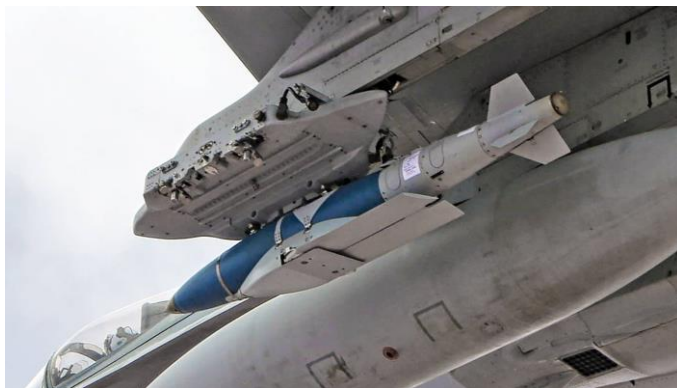
Слика 5. Бомба JDAM испод крила авиона B-52

На следећој Слици 5 приказана је бомба JDAM под крилом авиона B-52.