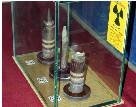
Слика. 6. Изглед метака са осиромашеним ураном којима су гађани наши простори (Војни музеј на Калемегдану)

плутонијума температура се повећава за још 400 °С, тако да достиже температуру горења до 3.400 °С.