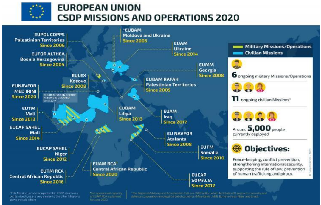
Слика 1. Мировне мисије и операције ЕУ у 2020. години

него све мисије и операције ЕУ у 2020. години 10 . Оно што је индикативно, кад су у питању НАТО операције, јесте чињеница да су извођене и мимо мандата Савета безбедности УН. Значајније мировне војне операције НАТО јесу: Пустињска олуја у Ираку (1991); ИФОР у Босни и Херцеговини (1995/1996); СФОР у Босни и Херцеговини (1996/2004); ИСАФ у Авганистану (од 2001); Ирачка слобода у Ираку (од 2003); Савезничка снага у СРЈ (1999); КФОР на Косову и Метохији (од 1999); Забрана лета у Либији (2011) и друге. У тим операцијама, укупно посматрано, учествовало је на стотине хиљада припадника НАТО снага, а последице су огромни људски губици и материјална разарања.